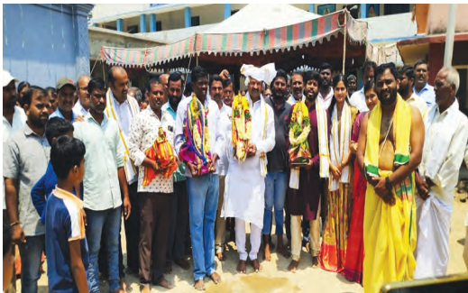
అనాసాగర్ లో శ్రీ సీతారామ చంద్రస్వామి అమ్మవార్డుకు పట్టువస్త్రాలు తీసుకువెళ్ళున్న మాజీ ఎమ్మెల్యే ఆల