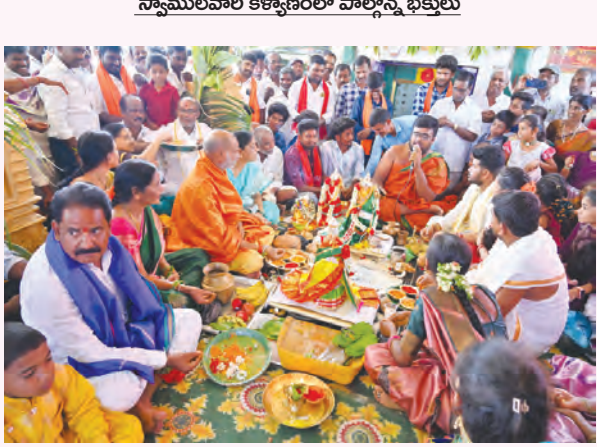
అంగరంగవైభవంగా సీతారాముల కళ్యాణం