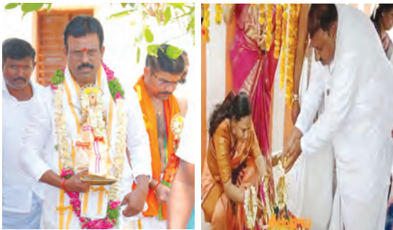
విగ్రహాన్ని కల్యాణ వేదికపైకి తీసుకువెళ్ళున్న ఎమ్మెల్యే జేఎంఆర్

- స్వర్ణమాలలో కల్యాణాలు జరిపించిన ఎమ్మెల్యే జేఎంఆర్,మాజీ ఎమ్మెల్యే ఆల