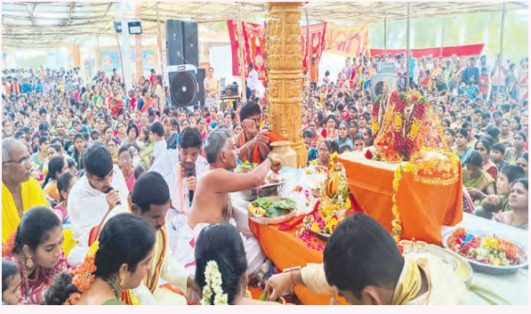
కళ్యాణోత్సవానికి హాజరైన భక్తులు

సీతారాముల వారి కళ్యాణ మహోత్సవం నిర్వహించారు. భక్తులకు వాకింగ్ సిండికేట్ అధ్వర్యంలో మజ్జీగా వ్యాకెట్టు, మహాలక్ష్మి సిండికేట్ అధ్వర్యంలో పానకం వంపిణి చేశారు. వేసవి కాలంలో భక్తులకు ఎండ వేడిమి తగలకుండా చలవ పందిరిలు ఏర్పాటు చేశారు. కళ్యాణం ఆనంతరం అక్కడే దేవాలయం కమిటీ భక్త బృందం దాతల సహకారంతో ఏర్పాటు చేసిన బోజన ప్రసాదాలు అందజేశారు. ఈ కార్యక్రమంలో పట్టణానికి చెందిన భక్తులు, మహిళలు పెద్ద సంఖ్యలో పాల్గొన్నారు.