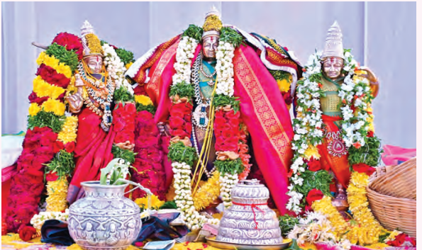
జీవపల్లి కోదండ రామాలయంలో