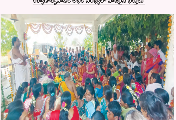
జాజినపల్లిలో సీతారాముల కళ్యాణ మహోత్సవం

కన్నుల పండుగా శ్రీ సీతారాముల కళ్యాణం... శ్రీరామనవమి వర్సదినం సందర్భంగా శ్రీ సీతారాముల కళ్యాణం అంగరంగ వైభవంగా శ్రీ