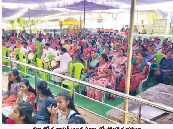
కళ్యాణోత్సవానికి అధిక సంఖ్యలో హాజరైన భక్తులు

కన్నుల పండుగా శ్రీ సీతారాముల కళ్యాణం... శ్రీరామనవమి వర్సదినం సందర్భంగా శ్రీ సీతారాముల కళ్యాణం అంగరంగ వైభవంగా శ్రీ