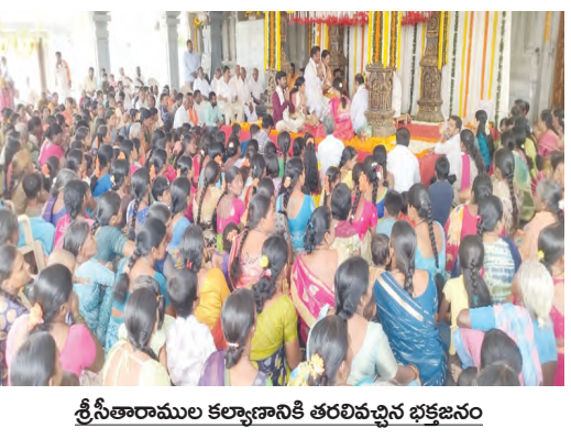
శ్రీ సీతారాముల కల్యాణానికి తరలివచ్చిన భక్తజనం