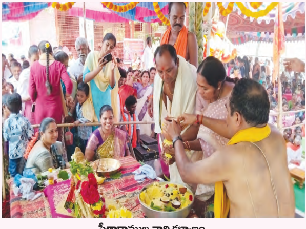
సీతారాముల వారి కళ్యాణం