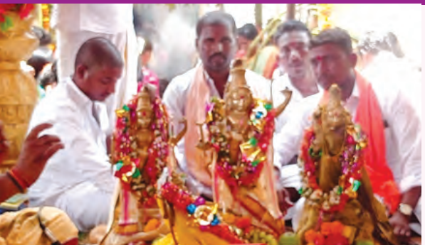
అంగరంగ వైభవంగా శ్రీ సీతారాముల కళ్యాణం