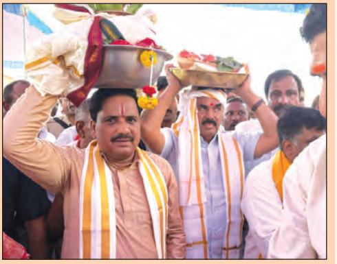
అమ్మవారికి పట్టువస్త్రాలు సమర్పిస్తున్న మంత్రి, ఎమ్మెల్యే