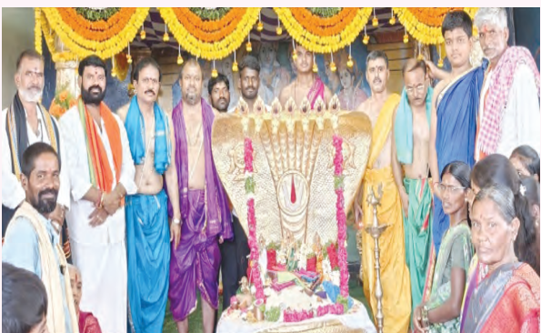
కళ్యాణోత్సవంలో పాల్గొన్న భక్తులు