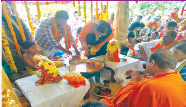
ఉప్పునుంతలలో జరిగిన సీతారాముల కళ్యాణోత్సవం