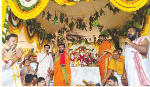
అమ్మవారి మెడలో వేసి తాళ చూయిస్తున్న ఆలయ అర్చకులు