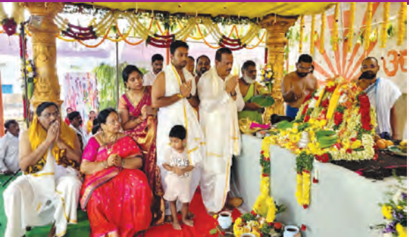
అత్తకూరులోని వెంకటేశ్వర స్వామి దేవాలయంలో..