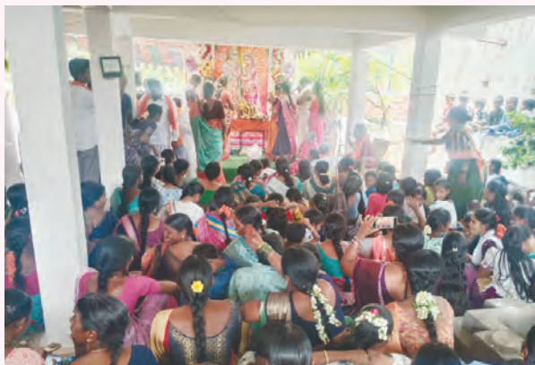
స్వామిలవారి కళ్యాణంలో పాల్గొన్న భక్తులు