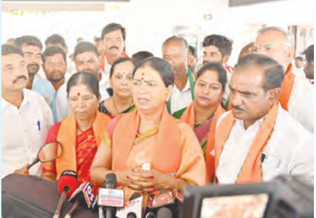
విలేజులలో మాట్లాడుతున్న ఎంపీ డీకే అరుణ

మహబూబ్ నగర్ బ్యూరో, ఏప్రిల్ 6, ప్రభాతవార్త: దేశ చరిత్రలో మరో కీలక ఘట్టం, కీలక ఆధ్యా యం లిఖితమైందని, వక్కీ సవర్ణ బిల్లుకు శ్రీరామ నవమి రోజున చట్ట బద్ధత కల్పించడం శుభభరణం అని వక్కీ సవర్ణ బిల్లు జాయింట్ పార్లమెం టరీ కమిటీ సభ్యురాలు, ఎంపీ డీకే అరుణ అన్నారు. మహబూబ్ నగర్ లో ఆమె మీడియాతో మాట్లాడారు. దేశం లోని వేలాది మంది వక్కీ బాధితుల న్యాయం జరగబోతోందని, దేశంలో వక్కీ పేరుతో లిటిగేషన్ లో ఉన్న వేల ఎకరాల భూములకు రిలిఫ్ రాబోతోం దన్నారు. వక్కీ సవర్ణ బిల్లుతో ము స్లీల ఆస్తులు, మసీదులు, కబరస్థానాలు తీసుకుంటారు, గుంజూరుని జరిగిన ప్రచారం అవాస్తవం అని, ఇలాంటివేమీ లేవని ఇప్పటికే నా ముస్లిం సోదరులు, ప్రజలు తెలుసుకోవాలిని పేర్కొన్నారు. వక్కీ పేరుతో జరిగిన మోసాచుకు ఈ చట్టంతో చెక్ పడిందన్నారు. అందరికీ న్యాయం చేసేందుకే.. వక్కీ బోర్డు ఏర్పాటు ఉద్దేశ్యం ఇస్లామ్ నెరవేరలేదని, ఇక్కడ అసలైన ముస్లిం మహిళలు, వితంతువులకు న్యాయం జరగించడన్నారు. వక్కీ పేరుతో ఇస్లామ్ కోర్టులు చేసిన ఆక్రమాలకు చెక్ పడిందని, ఈ బిల్లు చట్టరూపం దాల్చిన సందర్భంగా దేశ ప్రజలందరికీ ప్రత్యేక అభివృద్ధి కృతజ్ఞతలు తెలిపారు. వక్కీ బోర్డు సవర్ణ బిల్లును పార్లమెంట్ ఆమోదం తర్వాత ఇవాళ దేశ రాష్ట్రపతి ద్రౌపతి ముర్ము ఆమోదం తెలిపడం హాస్టేషన్ లో, అభివృద్ధి కృతజ్ఞతలు తెలిపారు. వక్కీ బిల్లుకు చట్టం రూపం తీసుకురావడంలో ప్రత్యేక కృషి చేసిన ప్రధాని నరేంద్రమోడి, హోం మంత్రి అమిత్ షా, మైనారీటీ శాఖ మంత్రి కిరన్ రిజిజుకే ప్రత్యేక కృతజ్ఞతలు తెలిపారు.