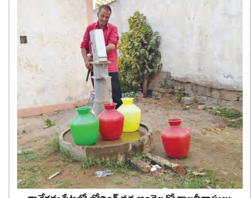
కావేరీ మట్టిలో బోలింగ్ వద్ద జంబెలతో కాలనివాసులు

జడ్పీ, ఏప్రిల్ 6, ప్రభాతవార్త: జడ్పీ మున్సిపాలిటీ ఆఫీసర్ల మట్టి పాత రోజులు వచ్చాయి. కావేరీ మట్టిలో తొంగిన అందక జనాలు నానా ఇబ్బందులను పడుతున్నారు. మిషన్ భగీరథ సీక్స్ రాక వారం రోజులు అవుతుందిని కాలనీవాసులు వాపోతున్నారు. ఈ చేసేదేమి లేక బోరింగులు, బోరు బావుల చుట్టూ తిరుగుతున్నారు. వివరాలిక్కే వెళ్తే.. మున్సిపాలిటీ పరిధిలోని కావేరీ మట్టి 2,11,10 వ వార్డులతోపాటు హోసంగి బోర్డు 8, 9 వార్డులకు మల్టీటోయిస్ట్ మిషన్ భగీరథ గ్రామ్ నుంచి తాగునీరు సరఫరా అవుతున్నది. గత ఐదారు నెలలుగా నీరు సరిపడా సప్లయ కావడం లేదని కాలనీవాసులు ఆరోపిస్తున్నారు. ప్రధానంగా గ్రామ్ వద్ద విద్యుత్ సమస్య ఉన్నట్లు తెలుస్తున్నది. నీరు సరిపడా - మిగతా 4..