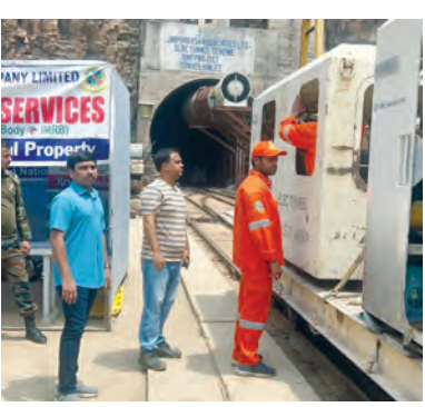
టన్నెల్ లో కొనసాగుతున్న సహాయక చర్యలు

నాగర్ కర్నూల్ ప్రతినిధి, ఏప్రిల్ 6, ప్రభాతవార్త: నాగర్ కర్నూల్ జిల్లా అచ్చంపేట నియోజకవర్గం అవగాహన మండలం దోమపేట గ్రామంలోని ఎన్.ఎల్.టి. టన్నెల్ ప్రమాద ప్రదేశంలో సహాయక చర్యలు నిరంతరం కొనసాగుతున్నట్లు టన్నెల్ ప్రత్యేక అధికారి శివకంఠ్ లోతేటి తెలిపారు. ఆదివారం ఎన్.ఎల్.టి. టన్నెల్ ఇన్ లెట్ 1 ఆఫీస్ వద్ద సహాయక బృందాల ఉన్నాధికారులతో కలిసి సహాయక చర్యలను పర్యవేక్షించారు. ఈ సందర్భంగా సహాయక బృందాల ఉన్నాధికారులకు పలు సూచనలు, సలహాలు ఇస్తూ రైల్వే సహాయక సిబ్బందితో పనిలను వేగవంతం చేయాలని ఆదేశించారు. శ్రీరామనవమి వండుగ సందర్భంగా సహాయక బృందాలకు శుభాకాంక్షలు తెలియజేశారు. కుటుంబాంతో జరుపుకోవాల్సిన వండుగలను సైతం రెక్కచేయకుండా సహాయక చర్యల్లో పాల్గొంటున్న సహాయక సిబ్బందిని ప్రత్యేకంగా అభినందించారు. ఎన్.ఎల్.టి. సొంగం లో కొన